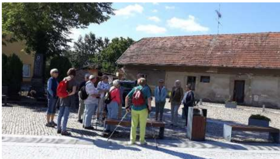
Náš autobus z Prahy zastavil na místní návsi přímo pod kostelem.